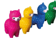
16 Spielfiguren, je 4 in den Farben gelb, pink, grün, blau