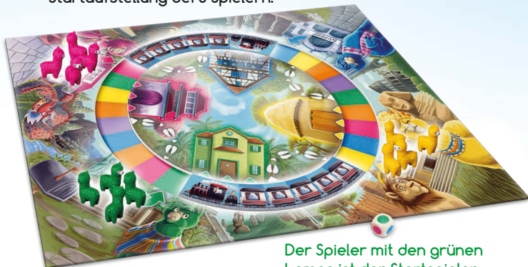
Der Spieler mit den grünen Lamas ist der Startspieler.

Wenn du an der Reihe bist, würfelst du mit dem Farbwürfel. Dann wählst du EINEN der beiden Züge und schiebst ihn so weit, bis die Spitze der Lokomotive das nächste Schienefeld berührt, das die gleiche Farbe wie der Würfel zeigt.