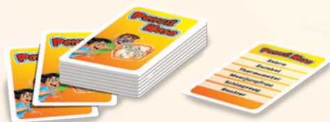
110 Karten mit je 6 Begriffen