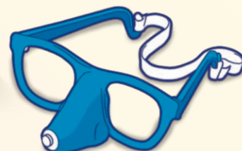
1 Zeichenbrille + Adapter